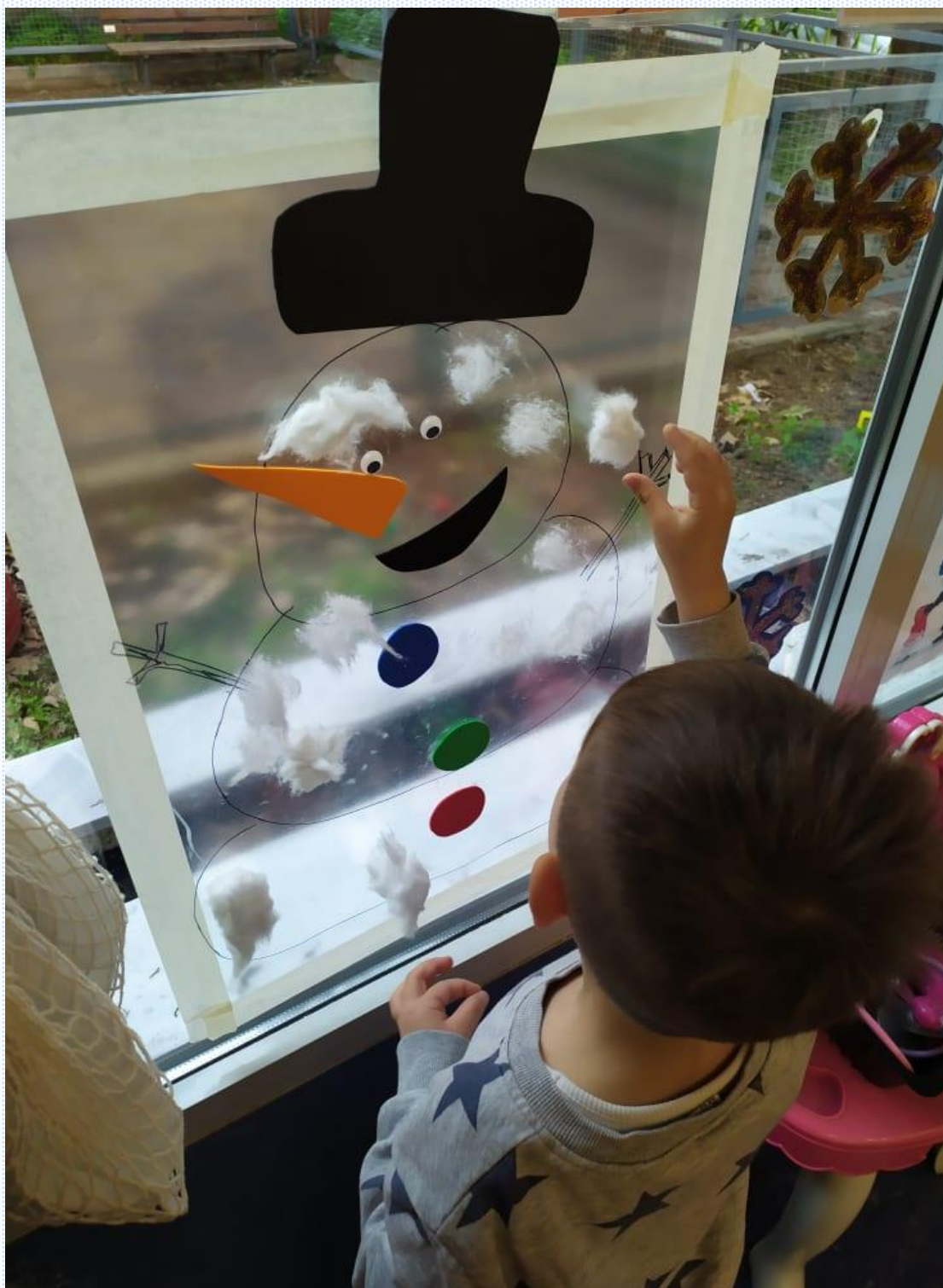
ΟΡΓΑΝΩΣΗ -ΥΛΟΠΟΙΗΣΗ ΔΡΑΣΕΩΝ : ΟΚΤΑΠΟΔΑ ΑΘΑΝΑΣΙΑ, ΠΟΠΗ ΑΠΟΣΤΟΛΑΚΟΥ, ΕΛΕΥΘΕΡΙΑ ΠΑΝΑΓΟΠΟΥΛΟΥ