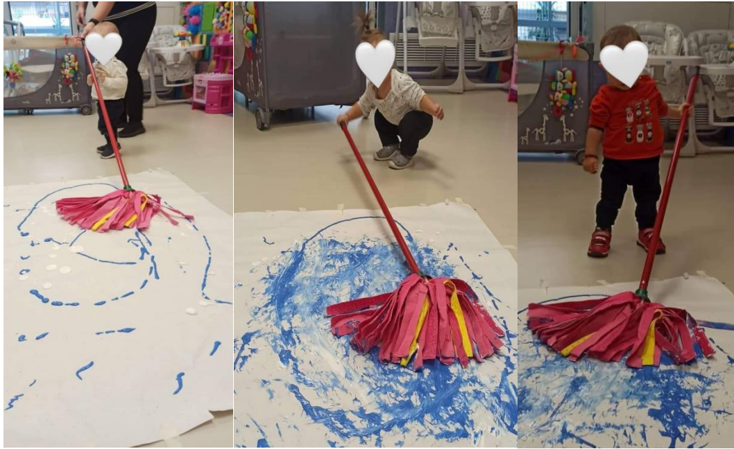
Με τη βοήθεια μιας σφουγγαρίστρας και με τα πινέλα...