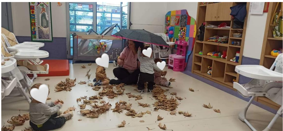
Και κρυβόμαστε κάτω από την ομπρέλα!!!