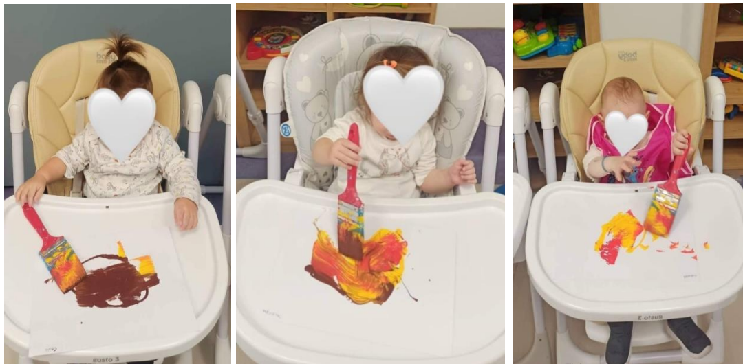
Φτιάξαμε τον άνεμο!!!