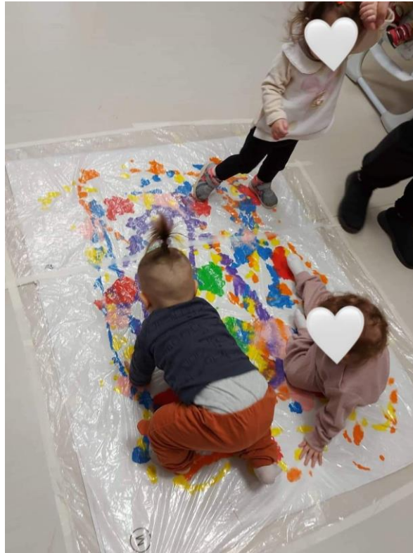
Δημιουργήσαμε μια ομπρέλα!!!