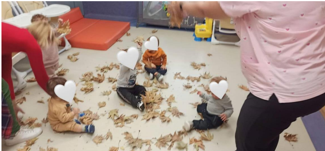
Φύλλα πέφτουν παντού...

Αναπτύξαμε τις κινητικές δεξιότητες μέσα από παιγνιώδη τρόπο, χορέψαμε υπό τους ήχους του Vivaldi τις 4 εποχές (το φθινόπωρο), το singing in the rain και δημιουργήσαμε τις πρώτες φθινοπωρινές εικόνες της τάξης μας.