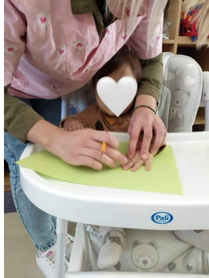
Το περίγραμμα των μικρών χεριών έγινε βροχή και παίζοντας με τα χρώματα...