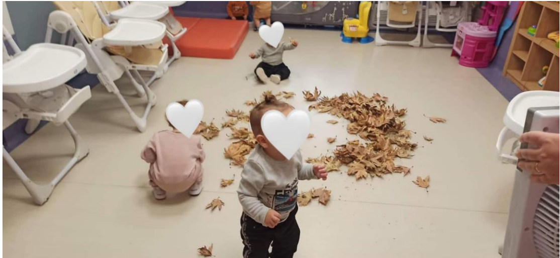
Ο άνεμος (με τη βοήθεια ενός ανεμιστήρα) τα σκορπάζει παντού