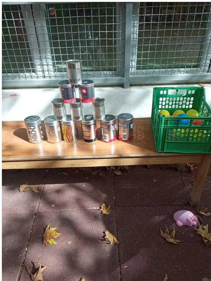
4° παιχνίδι: Στόχος με ανακυκλώσιμα υλικά (ντενεκεδάκια)