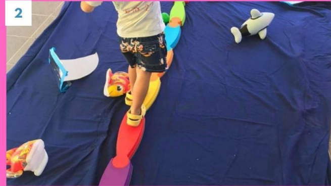
2 Μπορείς να τα καταφέρεις να περάσεις από πάνω χωρίς να πέσεις μέσα ;;;