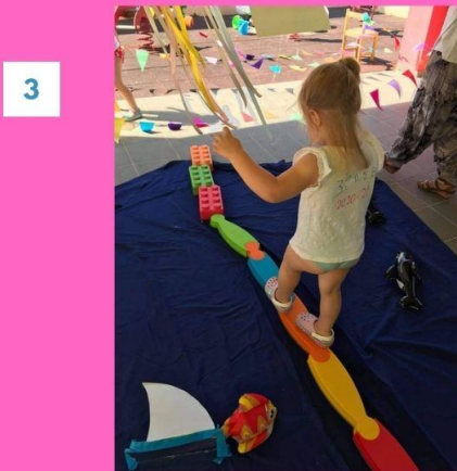
3 Μα φυσικά !!!