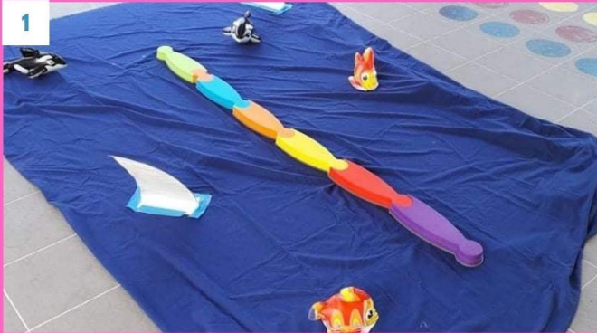
1 Μία επικίνδυνη θάλασσα γεμάτη καρχαρίες φάλαινες