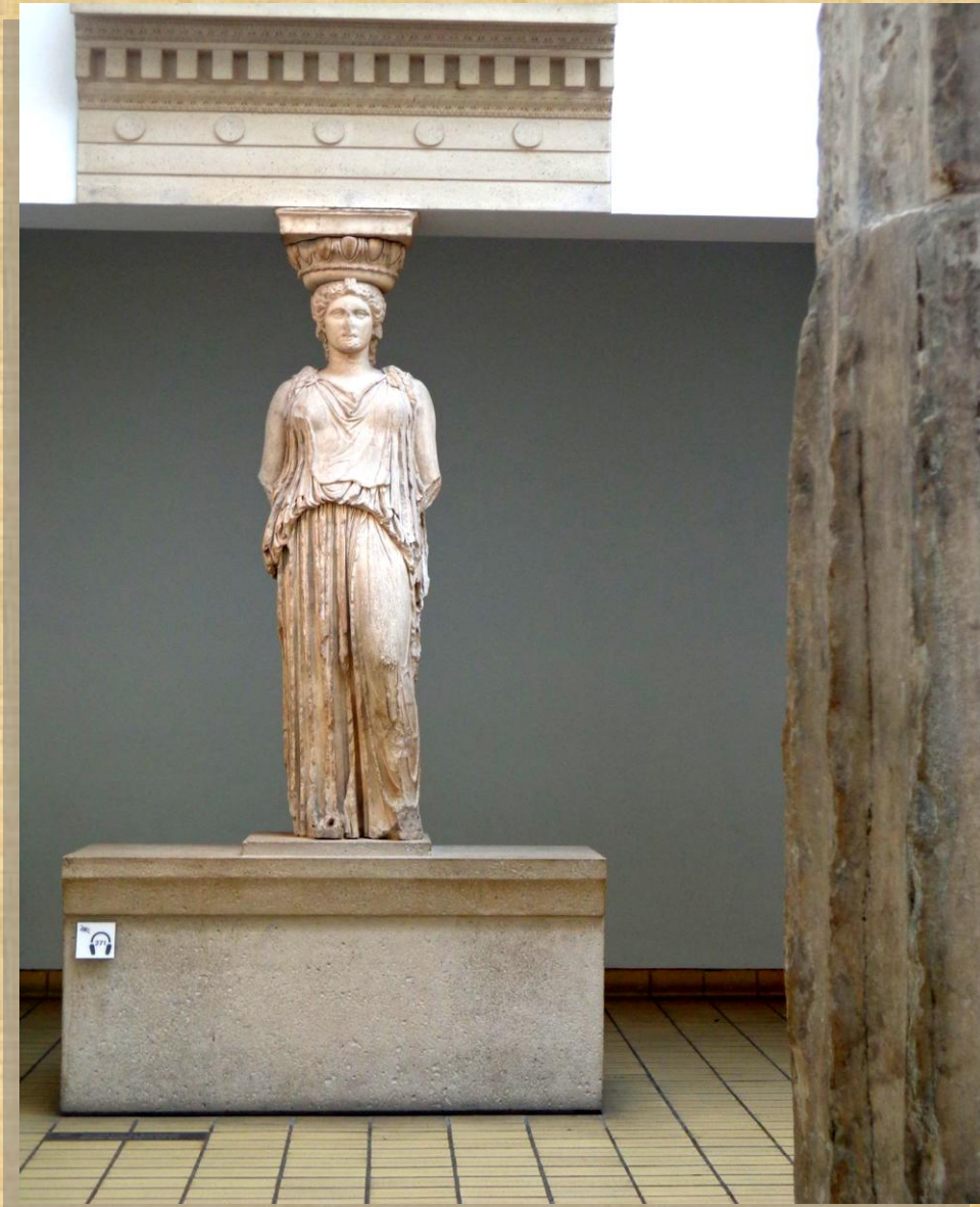
Βρετανικό Μουσείο, Λονδίνο

Μια μέρα στο μουσείο της Ακρόπολης ..... είναι μια μέρα γεμάτη ερεθίσματα για τα παιδιά. Μια μέρα για να αρχίσει το κυνήγι του κρυμμένου θησαυρού. Τί ψάχνουμε; Μα φυσικά τις αδελφές της Κάρυ τις Καρυάτιδες - αγάλματα γυναικών που στηρίζουν αντί για κίονες ένα τμήμα του Ερεχθείου. Κάποτε ήταν έξι αλλά τώρα η μια βρίσκεται μόνη στο ΛΟΝΔΙΝΟ που την έκλεψε ο ΕΛΓΙΝ.